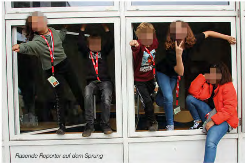
Rasende Reporter auf dem Sprung